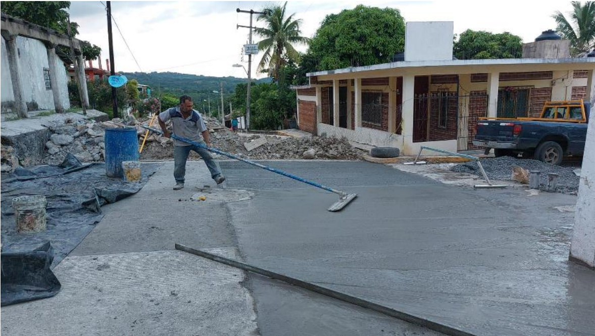
Construcción de pavimento en calles con concreto hidráulico.