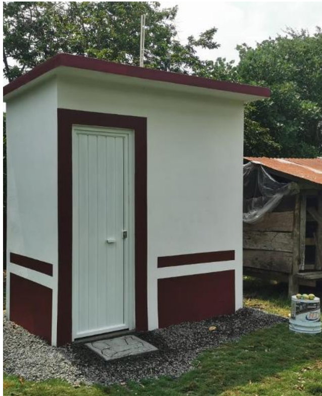
Construcción cuartos para baños.